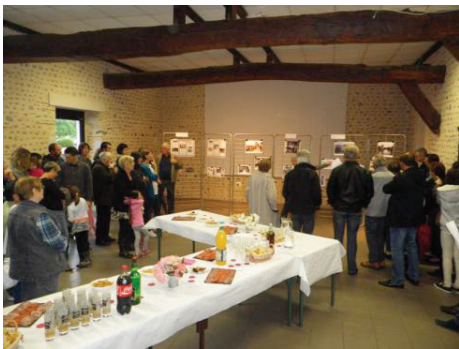
Fêtes des Mères à la Maison pour Tous

Nous vous informons que le site internet de la commune a été mis à jour, il sera réactualisé régulièrement.