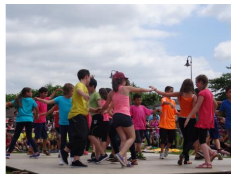
Le jour de la fête de l'école les enfants nous ont fait voyager dans le monde entier pour un spectacle haut en couleur